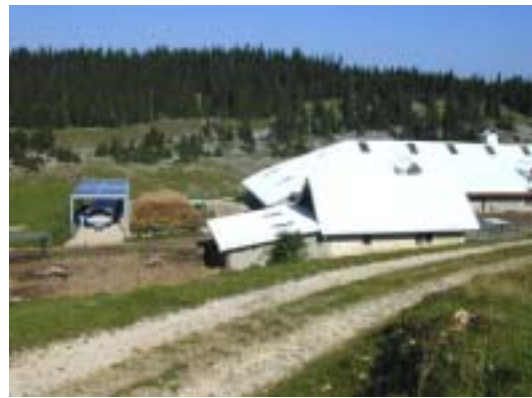
Figure 19: Installation autonome de l'alpage des Amburnex