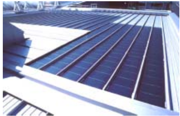
Figure 15: "Euro-toiture PV" Flumroc au silicium amorphe

Dans le cas de l'installation Solgreen de 10 kW c à Coire [53], Figure 16, la végétation se développe comme souhaité. La toiture-jardin et l'installation PV s'harmonisent parfaitement; il n'y a pas eu d'effet d'ombrage par des plantes trop hautes. L'expérience acquise en cours de montage a directement profité au perfectionnement du système Solgreen.