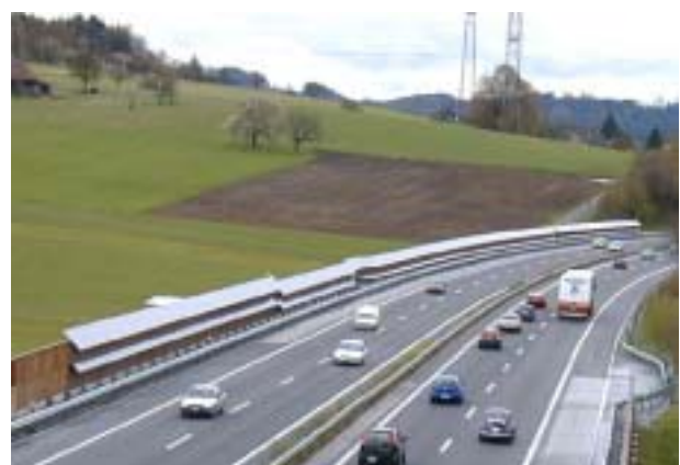
Figure 17: Installation de l'A1 à Safenwil, montée sur des parois anti-bruit