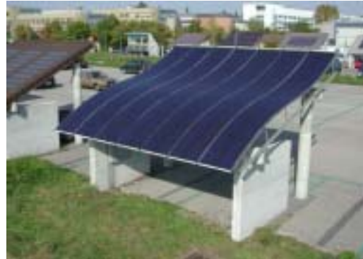
Figure 4: La toiture photovoltaïque Freestyle (Demosite)

Enecolo continue à participer au projet ENERBUILD [19] de l'UE destiné à répertorier, sous la forme du réseau thématique www.enerbuild.net , les activités R&D en cours en rapport avec l'énergie dans le bâtiment; il vise aussi le renforcement de la collaboration en la matière. Enecolo y est responsable du thème du photovoltaïque dans le bâtiment. L'année sous revue a vu la constitution d'un répertoire des activités en cours en Europe sur le sujet de l'intégration du photovoltaïque au bâtiment; on en a tiré une première série de propositions de stratégies futures ainsi qu'une évaluation des dispositions à prendre.