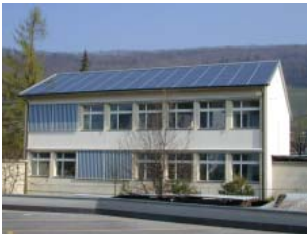
Figure 10: Intégration en toiture avec SOLRIF à Wettingen