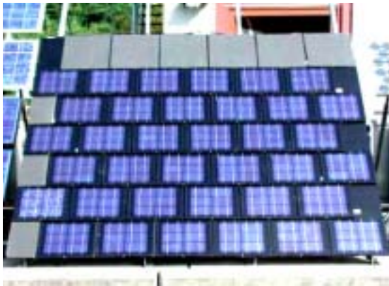
Figure 20: Stand d'essai des ardoises Sunplicity pour toitures