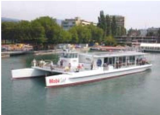
Figure 14: Inauguration du Mobicat