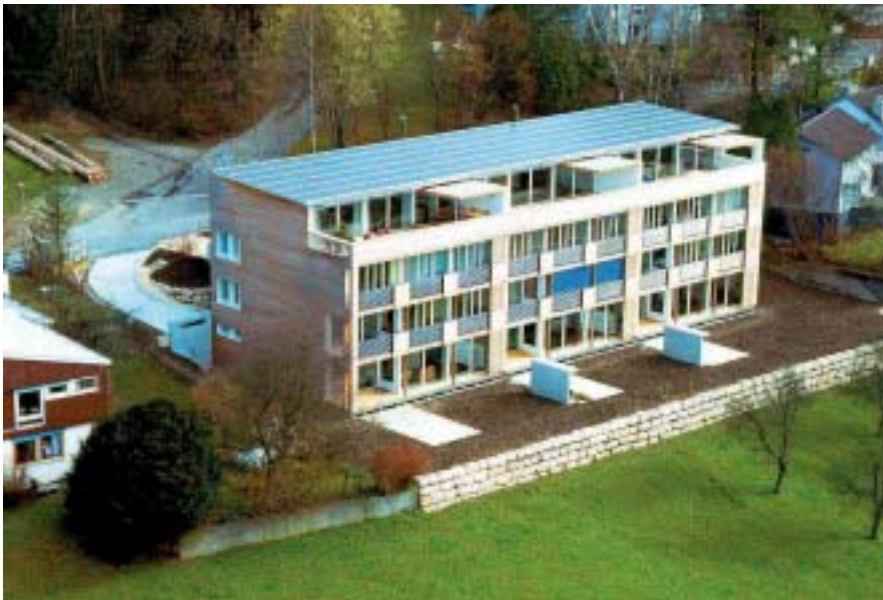
Figure 9: Installation PV 'Sunny Woods' à cellules amorphes triples (Source: bureau d'architecture Kämpfen)

11 projets nouveaux ont débuté en 2001 dans le cadre du programme P+D photovoltaïque. Une grande partie d'entre eux concerne l'intégration du photovoltaïque au bâtiment, principalement en toiture. La réalisation de l'immeuble à plusieurs appartements Sunny Woods [52] (Figure 9) à Zurich selon le standard de la "maison passive" a soulevé un intérêt considérable; toute la toiture est recouverte de cellules amorphes constituant une installation PV de 16 kW c entièrement intégrée. La campagne de mesures détaillées prévue par ce projet a commencé en mars 2002; les premiers résultats d'exploitation précis sont attendus pour la fin de 2002. Il sera intéressant de connaître les réactions de la population à cette toiture PV située en plein cœur de la zone protégée du "village" de Wettingen (AG) [83] (Figure 10). De même pour les installations photovoltaïques intégrées aux toitures-jardins, représentées dans le programme P+D notamment par la centrale Solgreen 1 à Zurich [54] (Figure 11).