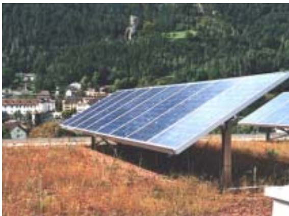
Figure 16: Installation Solgreen à Coire

La première année d'exploitation du système LonWorks de surveillance installé sur l'installation de 260 kW c de Felsenau [50], Figure 18, qui compte 68 onduleurs, confirme la bonne stabilité et la fonctionnalité du système. Le dépouillement définitif des données d'exploitation aura lieu à la fin de la période de mesure, au milieu de 2002, avec l'évaluation du projet.