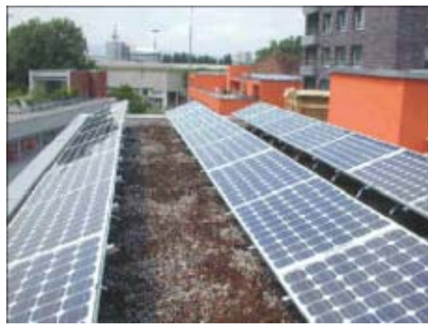
Figure 11: La centrale Solgreen 1 à Zurich