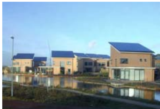
Figure 8: Intégration en toiture aux Pays-Bas, avec AluTec / AluVer