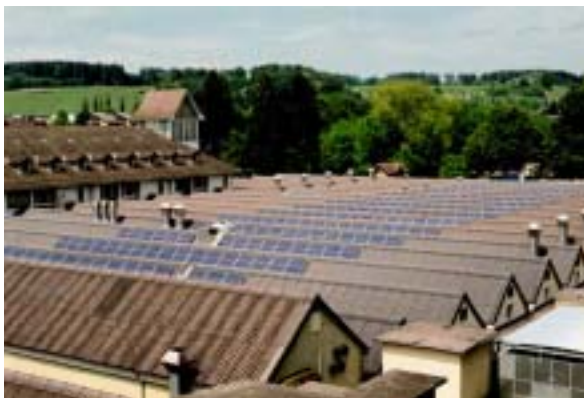
Figure 18: Installation de Felsenau avec surveillance LON