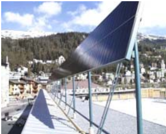
Figure 12: Installation à St-Moritz équipée de modules CIS