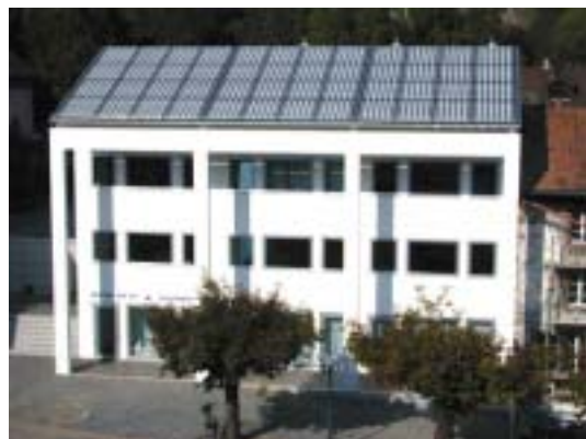
Figure 23: Toitures PV en vieille ville d'Unterseen