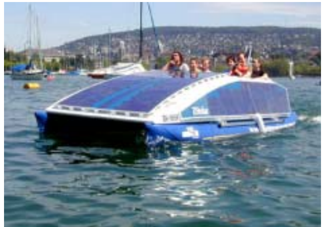
Figure 13: Bateau solaire de location, sur le lac de Zurich