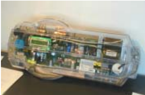
Figure 6: Ces dernières années, les onduleurs de la société Sputnik Engineering se sont fait une place sur le marché européen

Plusieurs produits suisses ayant leurs racines dans différents projets P+D ont continué à gagner des parts de marché en Europe, notamment des onduleurs (Figure 6) et des systèmes d'intégration et de fixation des modules. Le succès des deux systèmes de montage SOLRIF et AluTec / AluVer, qu'on devinait au début de l'an passé, s'est parfaitement confirmé. Jusqu'à la fin de 2001, des profilés SOLRIF pour modules PV [82] (Figure 7) ont été livrés dans l'Europe entière pour une puissance de crête d'environ 2 MW c ; de son côté, le système AluTec / AluVer (Figure 8) [48] a même dépassé les 3 MW c vendus. L'évolution observée pour ces deux systèmes laisse prévoir des chiffres d'affaires comparables voire supérieurs pour l'année en cours. Ces systèmes se placent donc parmi les développements P+D de ces dernières années ayant rencontré le plus grand succès.