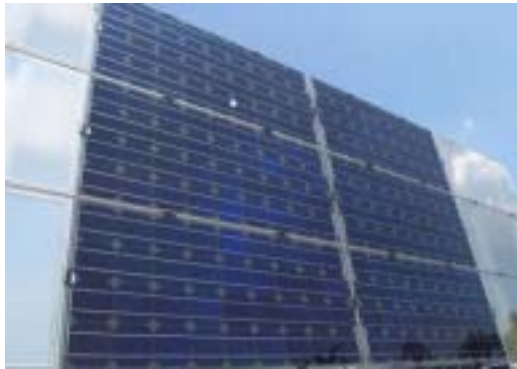
Figure 3: La façade photovoltaïque Solface (Demosite)