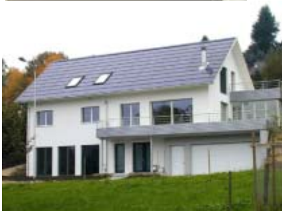
Figure 7: Intégration en toiture sur toute la surface, avec SOLRIF