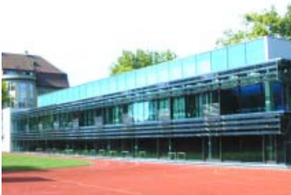
Figure 22: Ecole cantonale de Stadelhofen, Zurich