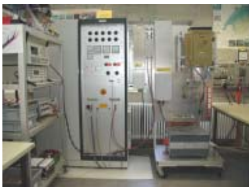
Figure 5: Le simulateur de générateur photovoltaïque de 25 kW de la HES de Berthoud

Dans le nouveau projet INVESTIRE [25] de l'UE, Dynatex collabore à l'évaluation à grande échelle des techniques de stockage applicables aux énergies renouvelables et, plus spécialement, aux installations photovoltaïques autonomes; ses partenaires de projet sont 19 entreprises et 15 laboratoires de recherche. L'analyse porte sur un total de 9 techniques de stockage, dont les principaux types de batteries (au plomb, au lithium, au nickel ainsi que du type métal-air) et un certain nombre de procédés moins courants comme les supercaps, le groupe "électrolyse/hydrogène/pile à combustible", le gyroscope, l'air comprimé et les systèmes redox. Chaque technique est caractérisée par des conditions d'application spécifiques; les possibilités de développement varient de l'une à l'autre. Les participants au projet en déduisent les dispositions qu'ils estiment nécessaire de prendre à l'avenir dans chaque cas.