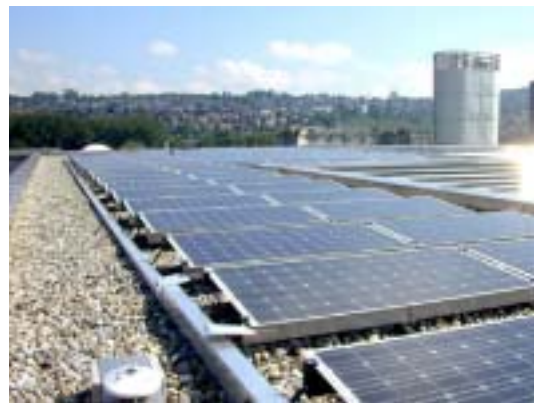
Figure 21: Installation en toiture plate d'IBM à Zurich