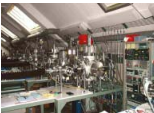
Figure 1: Réacteurs à plasma de l'IMT

Le PSI a poursuivi son projet de développement de cellules à faible largeur de bande interdite [6], prévues pour des applications thermo-photovoltaïques. Les travaux relatifs aux cellules photovoltaïques ont porté principalement sur des aspects fondamentaux de structures „à puits quantique“ ( quantum well ) de SiGe préparées par CVD dans un réacteur à ultraviolet.