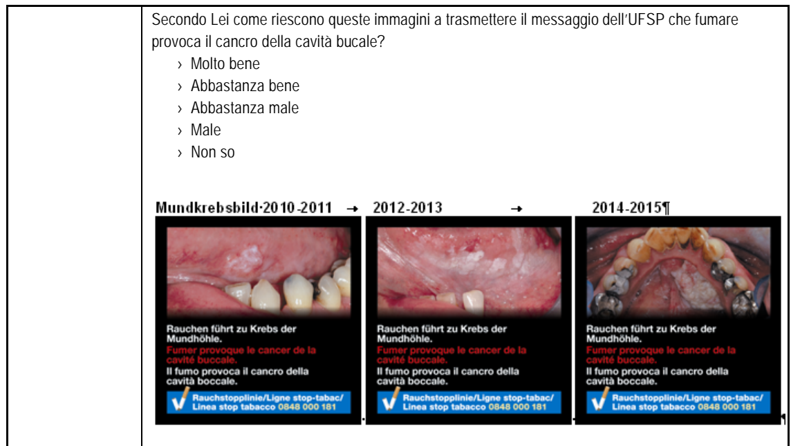
Tabella 1 Questionario indagine demoscopica (estratto sul tabacco).