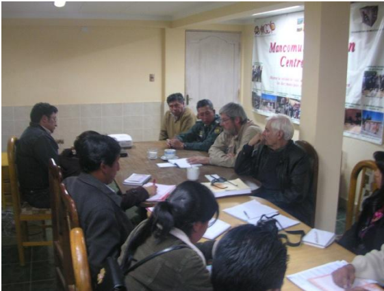
Miembros MCM Gran Centro Potosí