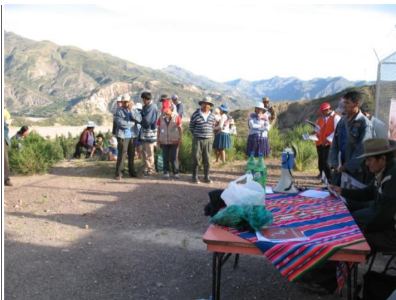
Con el Alcalde de Sayari e involucrados