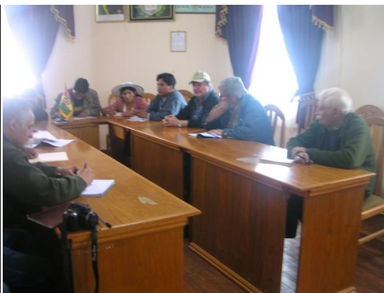
Alcalde de Anzaldo reunido con la ME