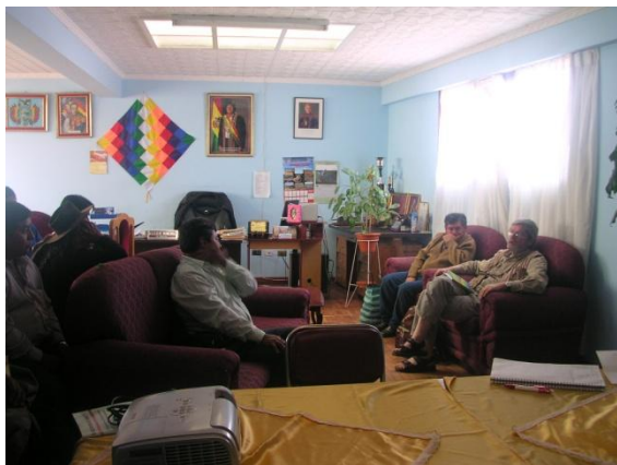
Alcalde de Betanzos con equipo evaluador