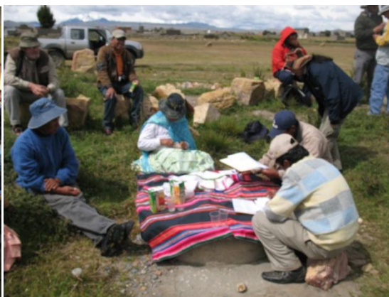
Con autoridades del M. Huarina y beneficiarios Pagando el seguro por riesgo de helada