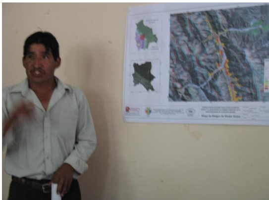
Mapa de Riesgo Municipio Sayari