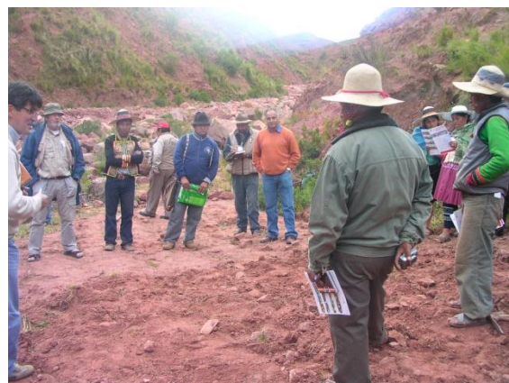
Experiencia productiva con un Japuchiri