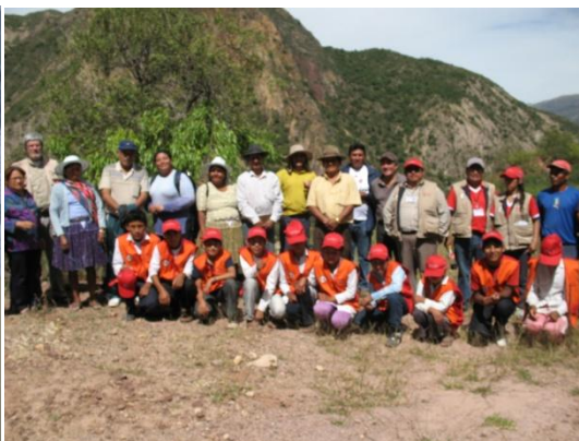
Equipo de MCM Andina Koroma