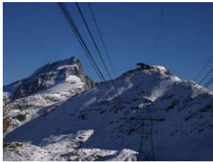
Bergstation Hohtälli/Zermatt auf 3286 müM.