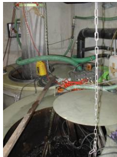
Enge Platzverhältnisse und doch eine vollständige Kläranlage: Im Bioreaktor (im Bild links, bzw. rechts vorne) werden Mikroorganismen mit Abwasser und Luft versorgt.