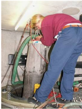
Der Klärschlamm wird in Filtersäcken entwässert; die noch verbleibenden Feststoffe werden ins Tal gebracht.