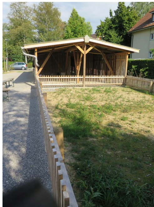
Schopf mit künftigem Gemüsegarten und zugänglichem Kompost