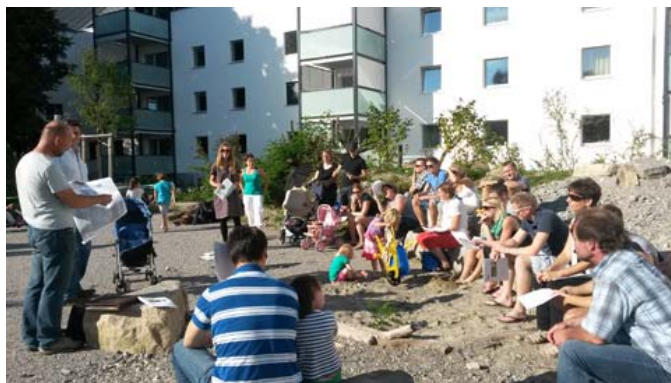
Abbildung 7 Impressionen aus den Workshops I und IV

Folgende Fazits können aus den Workshops gezogen werden: