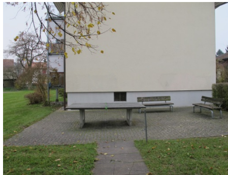
Abbildung 2 Impressionen Zustand des Aussenraumes bei Projektbeginn