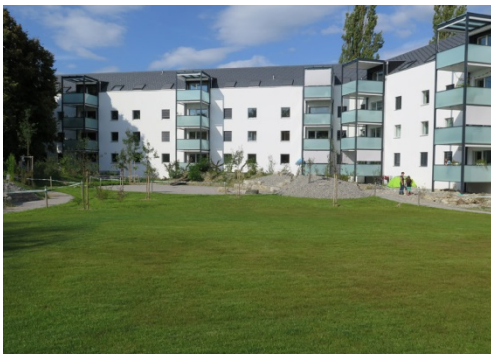
Extensiv gepflegte Wiese