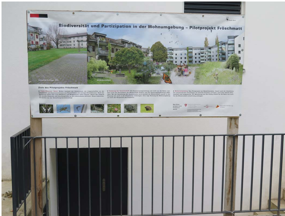
Abbildung 6 Informationsplakat vor der Liegenschaft Fröschmatt