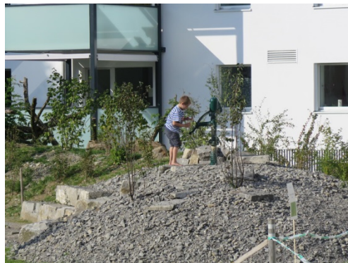
Kies- und Ruderalflächen