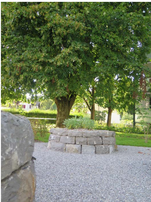
Kräuterhochbeet mit Trockenmauer