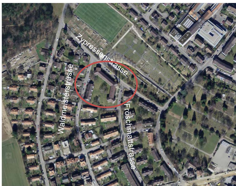
Abbildung 1 Lage der Liegenschaft Fröschmatt

Die Gebäudesanierung wurde erstmals in der Stadt Bern nach dem Standard MINERGIE P-ECO realisiert. Bei dieser Sanierungsform werden den Aspekten Komfort, Energieeffizienz, Gesundheit und Bauökologie besonderes Gewicht gegeben, sowohl während der Sanierung als auch für den gesamten Lebenszyklus der Gebäude. Im Rahmen der Sanierung wurde die Wohnungsstruktur verändert; bislang waren 45 kleinere 3-Zimmer-Wohnungen vorhanden. Mit der umfassenden Sanierung stehen neu 34 Wohnungen mit zwischen 2½ und 6½ Zimmern zur Verfügung. Nach der Sanierung zog eine komplett neue Mieterschaft in die Liegenschaften ein. Die angestrebte Mieterschaft ist gut durchmischt und besteht überwiegend aus Familien. Es wird eine lange Mietdauer und eine gute soziale Kontrolle angestrebt, sprich eine gewisse Eigenverantwortung jedes Bewohnenden und ein Bewusstsein für einen sorgsamen Umgang mit dem Aussenraum.